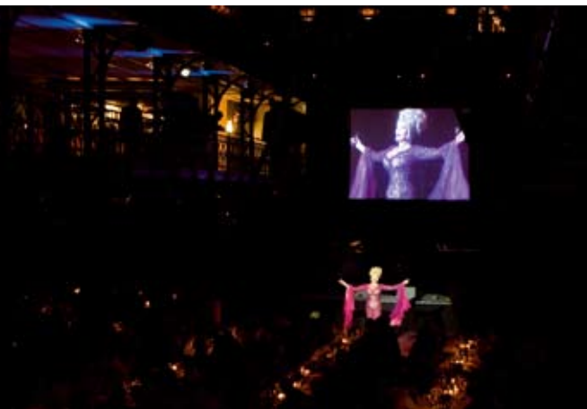
"Das Publikum war begeistert. So etwas bekommt man nicht oft zu sehen!" - tv-münchen